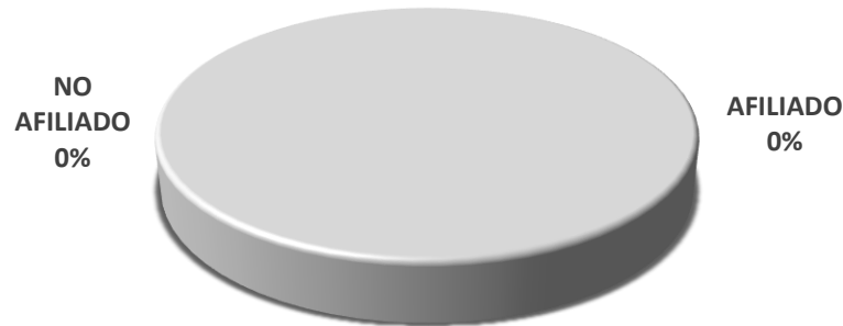
PARTICIPACIÓN CMIC POR NO. DE OBRAS