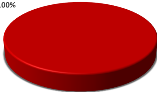
PARTICIPACIÓN CMIC POR NO. DE OBRAS