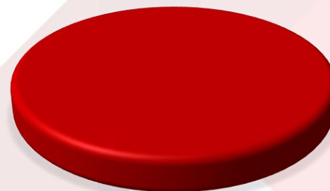
LICITACIÓN PÚBLICA 100%