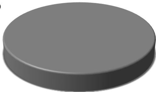
PARTICIPACIÓN CMIC POR NO. DE OBRAS